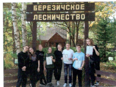
Участники выездов после награждения