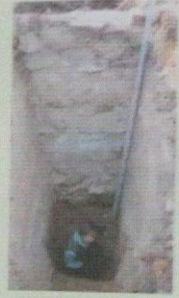
Остатки стены башни исследуются археологическим шурфом