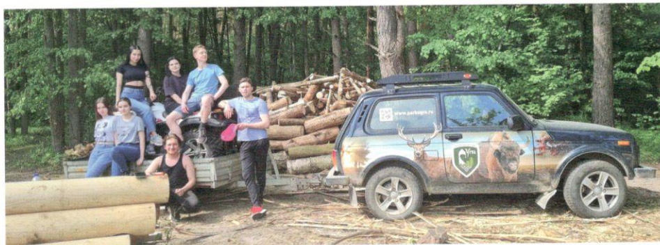
Результат первого выезда на Покровские курганы

Волонтерский сезон-2023 в национальном парке «Угра» прошёл с размахом и это, во многом, результат взаимодействия с Калужским филиалом Тимирязевской сельскохозяйственной академии. Студенты этого вуза уже много лет являются добрыми друзьями национального парка, этот год не стал исключением.