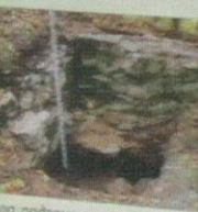
Начало подземного хода в основании стены

Отдельно стоящие башни — «донжоны» — характерный элемент средневековой западноевропейской фортификации. Они служили последним прибежищем для обороняющейся стороны. Опаковский «донжон», как и положено, стоял в самом неприступном месте: на стрелке мысы с очень крутыми склонами, с про-