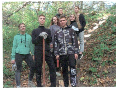
У построенной лесенки к роднику в Палатках