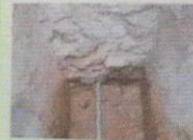
Основание стены башни — известняковая платформа