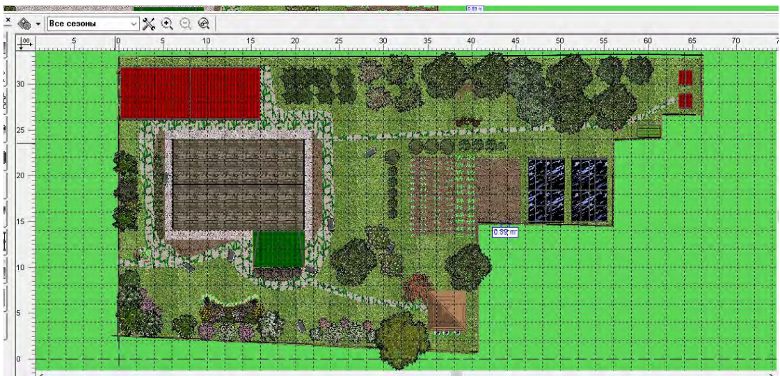
Рис. 2. План участка в программе «Наш сад» компании ДИКОМП.

Эскизный план, выполненный на миллиметровой бумаге студент переносит в компьютерную программу «Наш сад» компании ДИКОМП. Определяет площади, необходимые для расчета посадочного материала. Образец выполненной работы плана в программе «Наш сад» представлен далее (рис. 2).