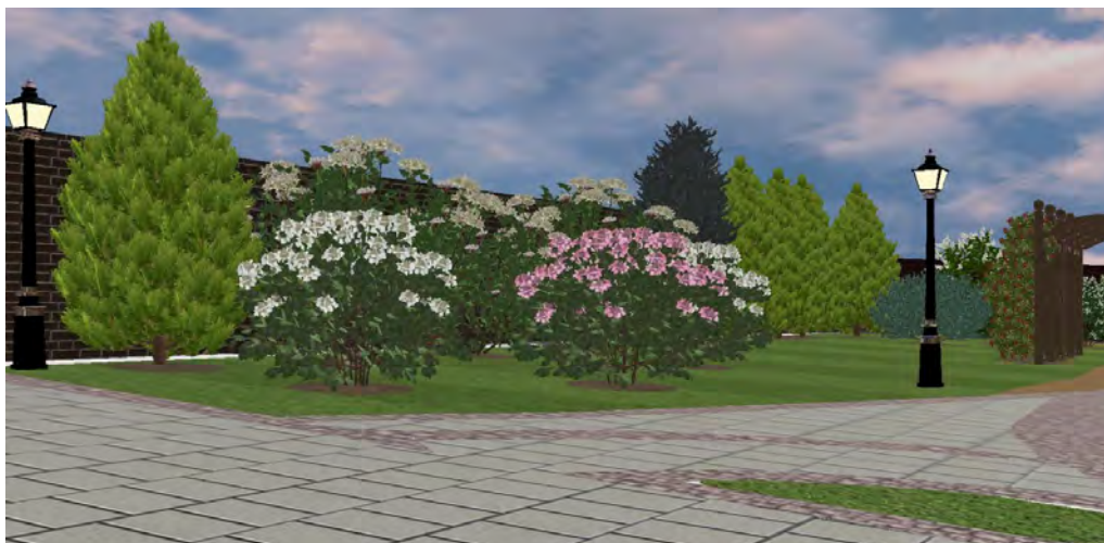
Рис. 5. Рабочий участок плана в аксонометрии

Качество запроектированного плана, выполненного в компьютерной программе «Наш сад» компании ДИКОМП проверяем, переводя программу в 3-Д моделирование. Оцениваем качество расчетов посадочного материала для данного конкретного участка. Каждый студент защищает работу по созданию плана участка в программе «Наш сад» компании ДИКОМП в аксонометрии. Образец одного вида территории участка показан далее (рис. 3).