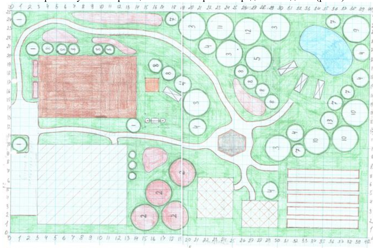
8. Рис. 1. План участка на мм. бумаге

Каждый студент получает контуры приусадебного участка. Переносит на миллиметровую бумагу в масштабе М 1:100. Проводит проектирование приусадебного участка на миллиметровой бумаге. Образец выполненной работы представлен далее (рис.1).