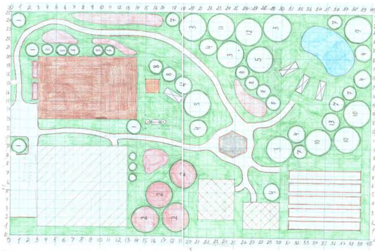
Рис. 1. План участка на мм. бумаге