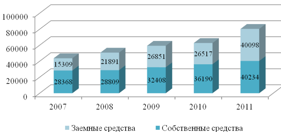
Рис. 3.1. Динамика пассивов ОАО «Каравай»

При оформлении графиков оси (абсцисс и ординат) вычерчиваются сплошными линиями. На концах координатных осей стрелок не ставят (рис.3.1). Числовые значения масштаба шкал осей координат пишут за пределами графика (левее оси ординат и ниже оси абсцисс). По осям координат должны быть указаны условные обозначения и размерности отложенных величин в принятых сокращениях. На графике следует писать только принятые в тексте условные буквенные обозначения. Надписи, относящиеся к кривым и точкам, оставляют только в тех случаях, когда их немного, и они являются краткими. Многословные надписи заменяют цифрами, а расшифровку приводят в подрисовочной подписи.