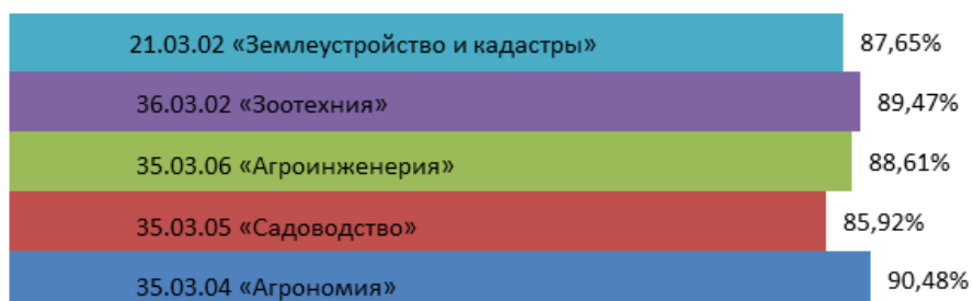
Рисунок 3 – Доля занятых в организациях выпускников бакалавриата 2025 года

Важным показателем эффективности работы и привлекательности региона является тот факт, что, по данным Центра карьеры, 53% выпускников 2025 года, прибывших из других субъектов РФ, приняли решение остаться для трудовой деятельности в Калужской области.